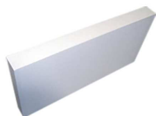
Panneaux KNAUF Therm Th38 SE